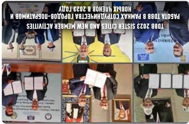
TDBB 2023 SISTER CITIES AND NEW MEMBER ACTIVITIES РАБОТА ТДБВ В РАМКАХ СОТРУДНИЧЕСТВА ГОРОДОВ-ПОБРАТИМОВ И НОВЫХ ЧЛЕНОВ В 2023 ГОДУ