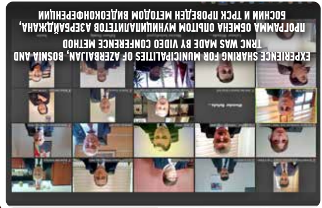
EXPERIENCE SHARING FOR MUNICIPALITIES OF AZERBAIJAN, BOSNIA AND TRNC WAS MADE BY VIDEO CONFERENCE METHOD ПРОГРАММА ОБМЕНА ОПЫТОМ МУНИЦИПАЛИТЕТОВ АЗЕРБАЙДЖАНА, БОСНИИ И ТРНСК ПРОВЕДЕН МЕТОДОМ ВИДЕОКОНОФЕРЕНЦИИ