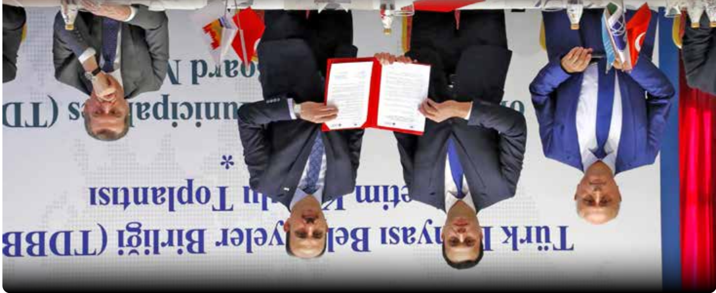
TDBB SIGNED COOPERATION PROTOCOL WITH KAZAKHSTAN UNION OF LOCAL GOVERNMENTS AND UZBEKISTAN MAHALLABAY STUDIES AGENCY ТАКЖЕ АГЕНТСТВОМ ПО РАБОТЕ МАХАЛЛАБАЙ УЗБЕКИСТАНА ПОДПИСАН ПРОТОКОЛ О СОТРУДНИЧЕСТВЕ МЕЖДУ ТДБВ И СОЮЗОМ ОРГАНОВ МСУ КАЗАХСТАНА

TÜRK DÜNYASI BELEDİYELER BİRLİĞİ UNION OF TURKISH WORLD MUNICIPALITIES СОЮЗ МУНИЦИПАЛИТЕТОВ ТУРКСКОГО МИРА